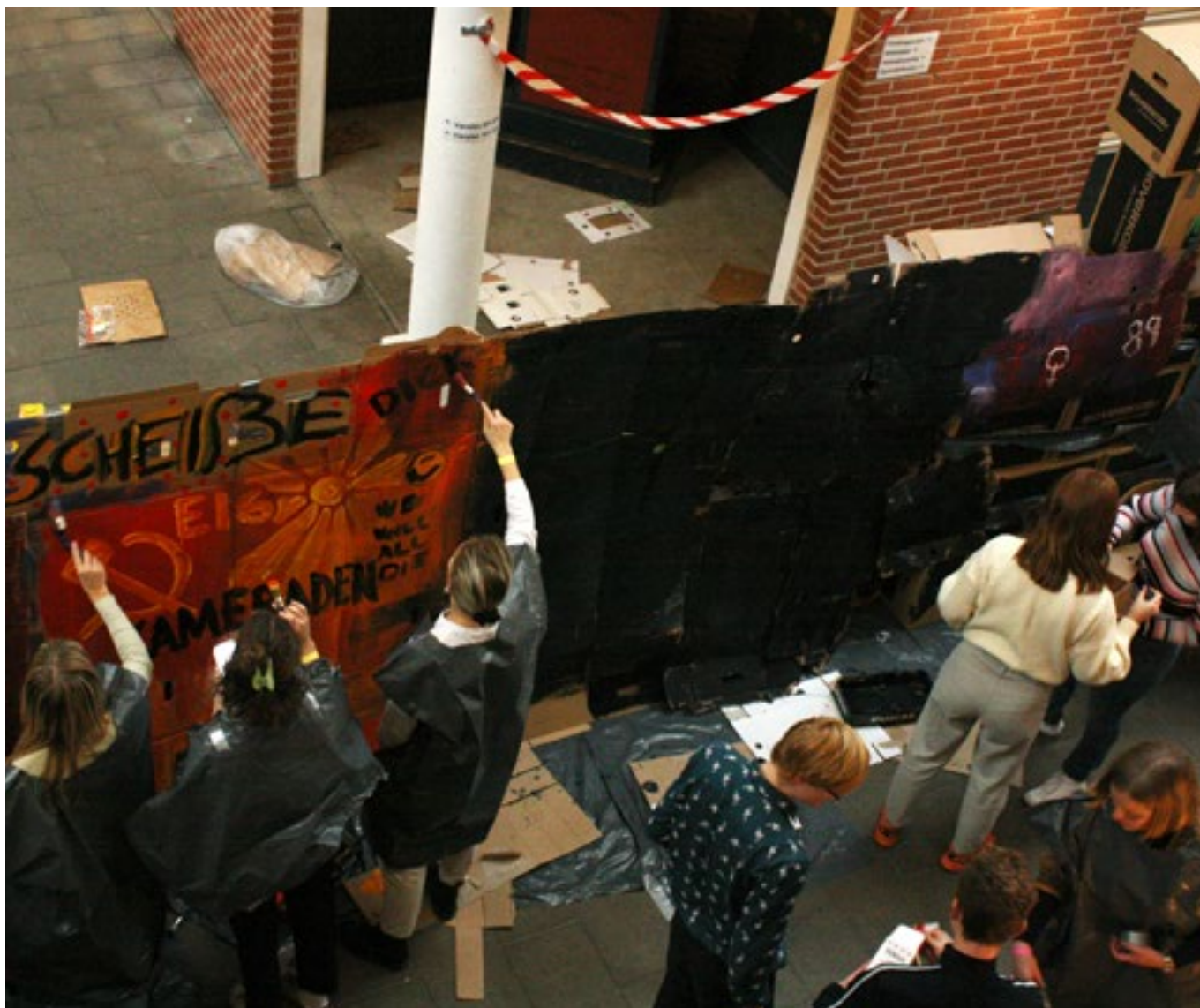
“Build up this wall” - workshopen, hvor vi byggede berlinmuren, for derefter at rive den ned igen.