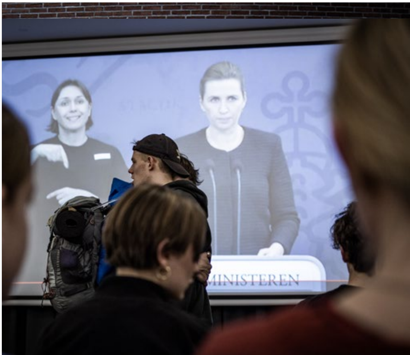
Regeringen lukker ned, og højskoleboblen brister.